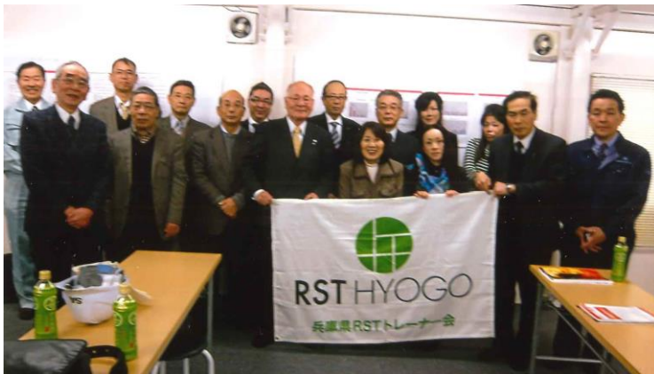
亀山鋳造所会議室にて 参加者全員記念写真

工場内は、危険有害な箇所もあり、電気炉作業(高温)、フォークリフト運転作業、粉じん作業、切断作業等を巡視しました。